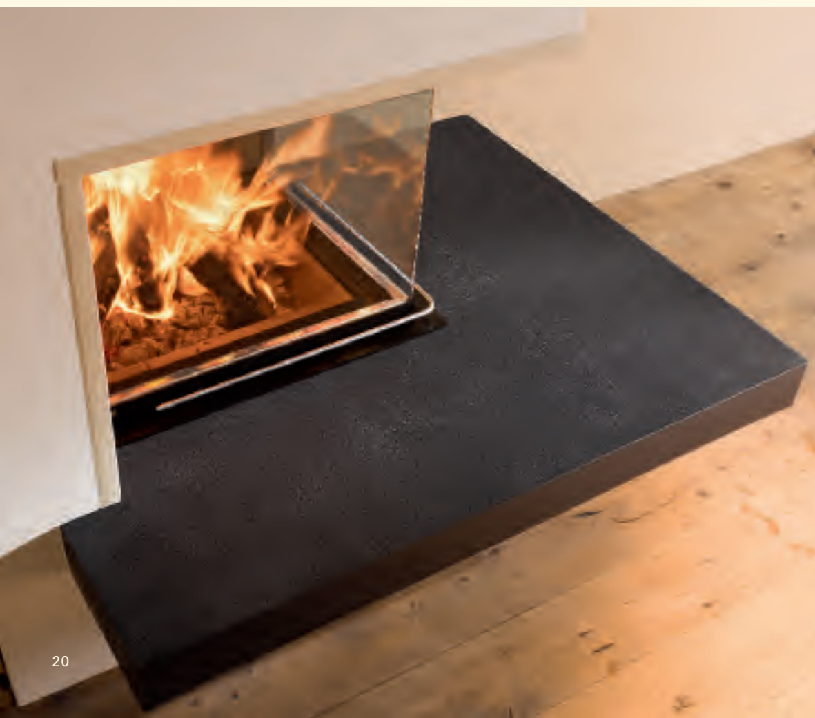
2054_1: Feuertisch MAXIMUS K 179, Feuerkachel MAXIMUS Rille quer K 241 Glasur: granit dunkel, düne Technik: Brunner KE 316,0

Es gibt Plätze in unserem Leben, die wir als besondere Punkte wahrnehmen. Dort holen wir uns Energie und Lebenskraft für die Aufgaben, die uns das Leben bereit hält. Das Feuer und die keramische Wärme der großen Formelemente von Sommerhuber schaffen einen solchen besonderen Platz.