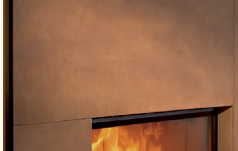
2050: Feuerkachel MAXIMUS glatt K 241 Glasur: rost Technik: Spartherm KE 200,0