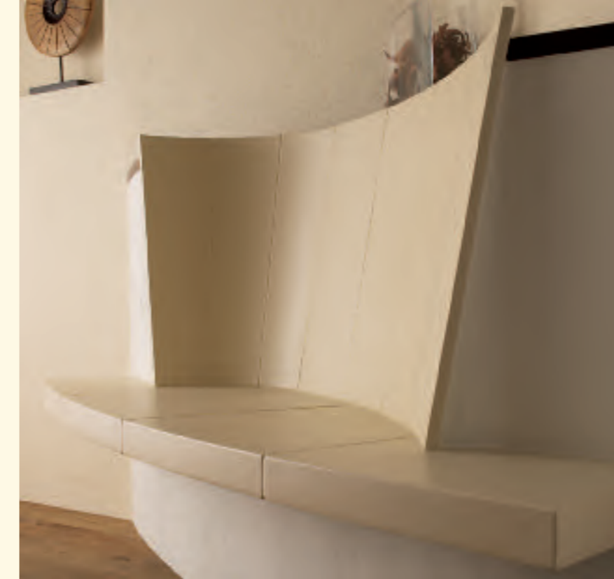
2047_1: Rückenschild K 378, Feuertisch S 179 Glasur: cacao dunkel, perla Technik: Brunner KE 351,0

Der Kachelofen als Quelle der Entspannung und Harmonie. Die Kacheln von Sommerhuber lassen die Aufnahme der Wärme in einer besonderen Form zu. Schmiegen Sie sich an die samtweiche Keramikoberfläche und genießen Sie die wohlig warmen Strahlen.