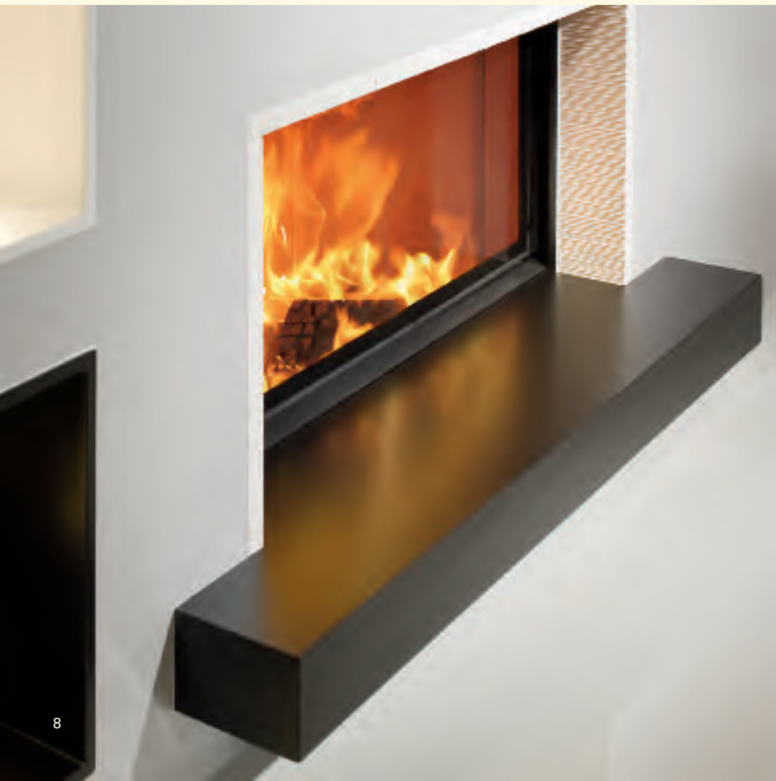
2060: Feuertisch K 179, Plattsims Rille fein K 387, Nische quadratisch Glasur: schwarz matt, schmelzweiß matt Technik: Brunner KE 188,0

Die Einfachheit der Gestaltung lässt den Blick klar werden. Gerade Linien und große Flächen reduzieren die Wahrnehmung auf das Wesentliche – auf das archaische Erlebnis Feuer – und lassen uns die Kraft der Natur spüren. Erleben Sie die uneingeschränkte Energie des Feuers.