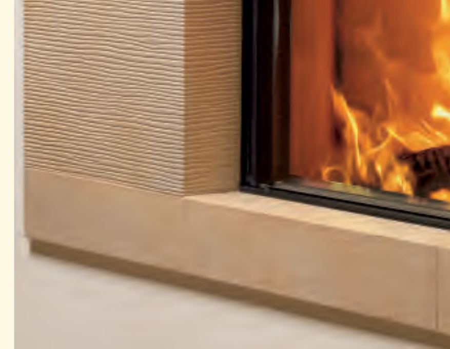
2044_3: Feuerrahmen glatt und Rille quer K 240 Glasur: hanf hell Technik: Spartherm KE 137,0

Die Anmut natürlicher Formen einzufangen und in einer einzigartigen keramischen Form umzusetzen, darauf ist man in der Keramik Manufaktur Sommerhuber stolz. Die Wärme der Keramik schafft eine unvergleichliche, natürliche Atmosphäre.