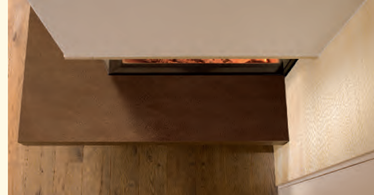
2057: Feuertisch MAXIMUS K 179, Feuerkachel MAXIMUS Rille quer K 241 Glasur: rost, solnhofen Technik: Spartherm KE 350,0

Wahre Größe hängt von Großzügigkeit ab. Eine Feuerstelle in einem besonderen Raum großzügig zu gestalten, von dieser Idee fasziniert hat die Keramik Manufaktur Sommerhuber KACHEL GANZ GROSS entwickelt – einem Monolithen gleich. Ein ganzes Stück Keramik, der richtige Werkstoff um jedem Feuer den passenden Rahmen zu geben.